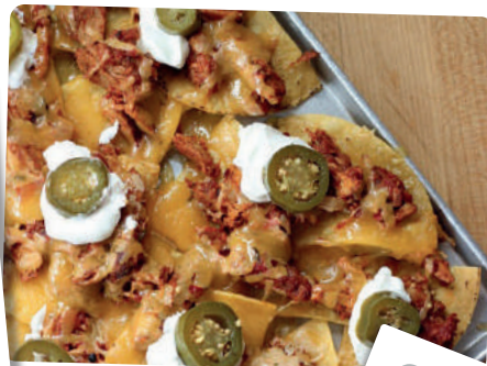
naczosy pulled pork pulled pork nachos