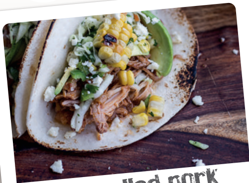
tacos pulled pork z kukurydzą crockpot enchilada pork tacos with sweet corn slaw