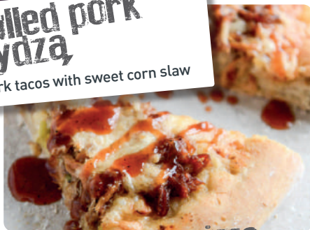
pulled pork pizza z czosnkiem, serem i porem pulled pork pizza with maple leeks, roasted garlic and aged cheddar