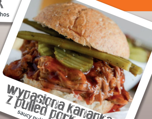
wypasiona kanapka z pulled pork saucy pulled pork sandwiches